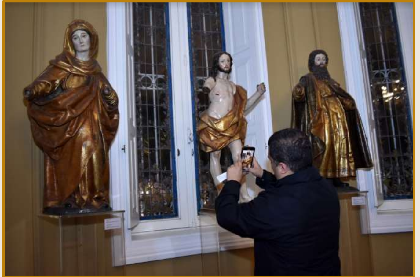
Créditos: Museo Pedro de Osma. Sala 5, Esculturas.

El arte desempeña un papel mediador y motor de la comunicación, ya que el artista a través de su creación transmite emociones y mensajes. Propicia la reflexión sobre nuestra existencia, los problemas sociales o la vida en general.